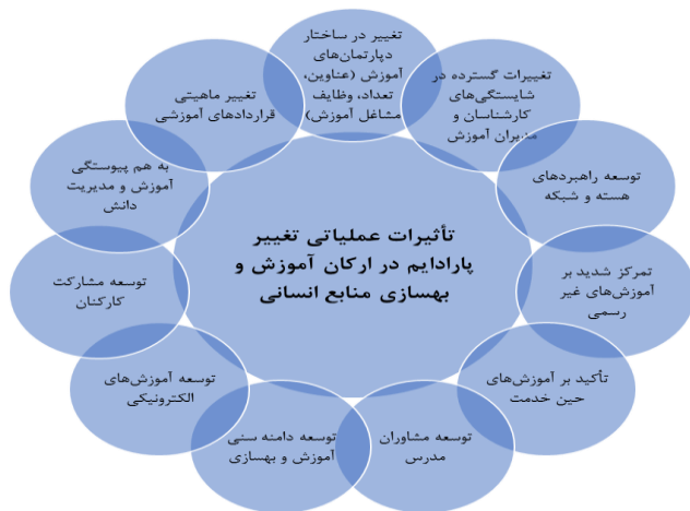
شکل ۱: تأثیرات عملیاتی تغییر پارادایم در ارکان آموزش و بهسازی منابع انسانی

یکی از تأکیدات این تغییر پارادایم استفاده از روش‌های متفاوت و ترکیبی در آموزش و بهسازی منابع انسانی می‌باشد که در شکل شماره یک تأثیرات عملیاتی تغییر پارادایم آموزش به یادگیری در ارکان آموزش و بهسازی منابع انسانی نشان داده شده است (۱۶).