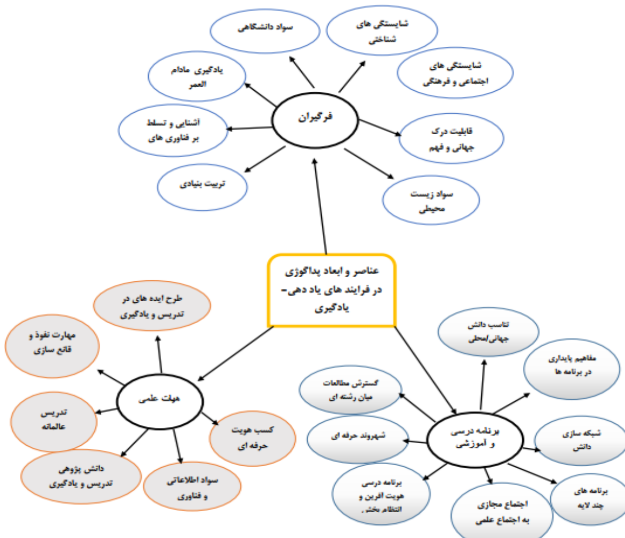
نمودار ۱: شبکه مضمون بعد پداگوژی در فرایندهای یاددهی-یادگیری

اقتصادی)، با میانگین ۲/۶۷ در بدترین وضعیت از دیدگاه اساتید دانشگاه‌های دولتی و غیردولتی قرار دارند. باتوجه به این‌که میزان چولگی و کشیدگی متغیر دانشگاه پایدار و سؤالات آن در حد مطلوبی (چولگی کم‌تر از ۳، و کشیدگی کم‌تر از ۱۰) قرار دارند، می‌توان گفت داده‌ها دارای پیش‌فرض توزیع نرمال می‌باشند.