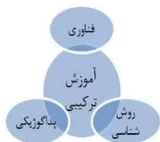
شکل ۱: ابعاد تشکیل دهنده آموزش ترکیبی (۱، ۱۷، ۱۸، ۱۹، ۲۰).