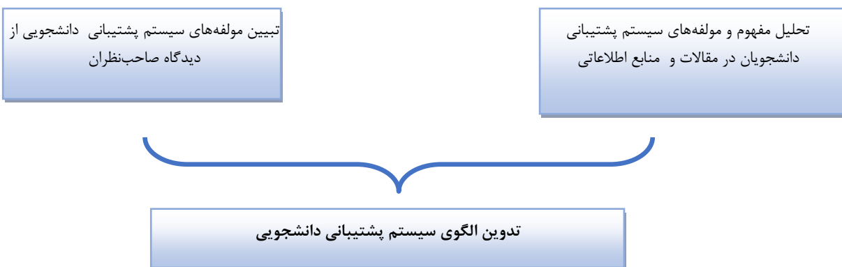
شکل ۱: مراحل تدوین الگوی سیستم پشتیبانی دانشجویی دانشگاه‌های علوم پزشکی در محیط آموزش مجازی

بودند، برای مطالعه متن کامل مقاله انتخاب و مبنای تحلیل قرار گرفت. ۲- نتایج تحلیل محتوای مصاحبه نیمه‌ساختاریافته با ۱۷ نفر از متخصصان و صاحب‌نظران حوزه آموزش مجازی دانشگاه‌های علوم پزشکی کشور گردآوری شد. افراد مشارکت‌کننده در مصاحبه به صورت هدفمند انتخاب شدند و انجام مصاحبه‌ها تا اشیاع اطلاعاتی داده‌ها ادامه یافت. تحلیل تماتیک داده‌های حاصل از مصاحبه‌ها، به روش آترید استرلینگ (Attride-Stirling) صورت گرفت. در این روش بعد از پیاده‌سازی محتوای مصاحبه‌ها کدگذاری و به‌دنبال آن طبقه‌بندی کدها و استخراج تم‌های اصلی و تم‌های فرعی به‌عنوان مولفه‌های اصلی و زیرمولفه‌های سیستم پشتیبانی دانشجویی صورت گرفت (۱۴). با تلفیق داده‌های به‌دست‌آمده، الگوی سیستم پشتیبانی دانشجویی در محیط آموزش مجازی